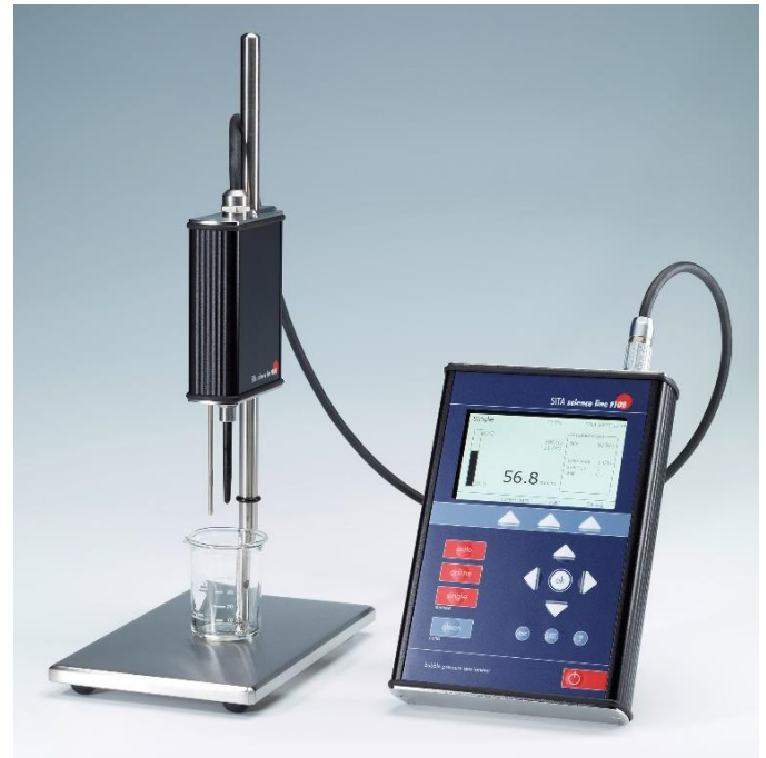
Abbildung 1: SITA science line t100

Unterstützt durch Software kann die Konzentrationsabhängigkeit automatisch bestimmt werden. Aus den gewonnenen Daten lassen sich dann leicht Konzentrationsprofile entwickeln, um Prozesslösungen mit Grenzwerten zu überwachen.