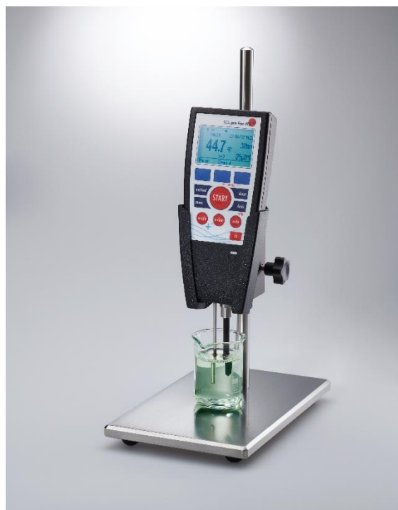
Abbildung 1: SITA pro line t15+ zur Messung der dynamischen Oberflächenspannung

Eine optimale Benetzung (Spreitung) findet dann statt, wenn die Oberflächenspannung der flüssigen Farbe zum Zeitpunkt des Kontaktes niedriger ist als die Oberflächenenergie des Substrates. Da es sich beim Farbauftrag wie Spritzen oder Sprühen um zeitkritische Benetzungsvorgänge handelt, kommt der TensidAuswahl und speziell der Dynamik des Tensides eine wichtige Bedeutung zu. Die Art und Konzentration des ausgewählten Tensids bestimmt wesentlich die Dynamik im Benetzungsverhalten (siehe Abbildung).